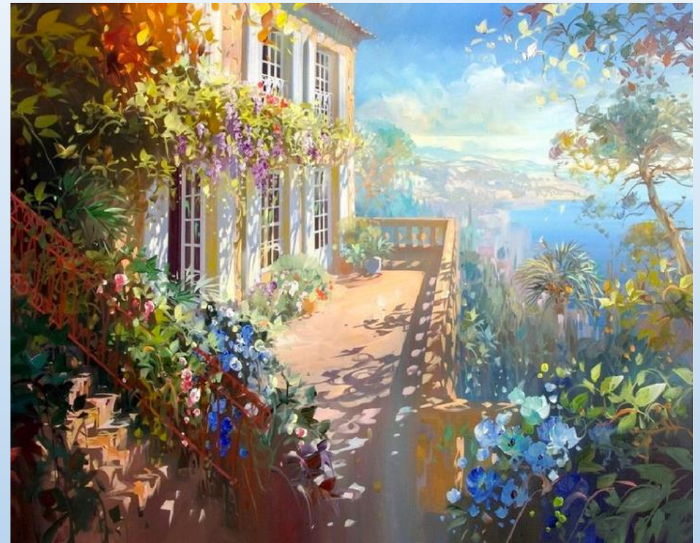
«Солнечные зайчики» Лоран Парселье